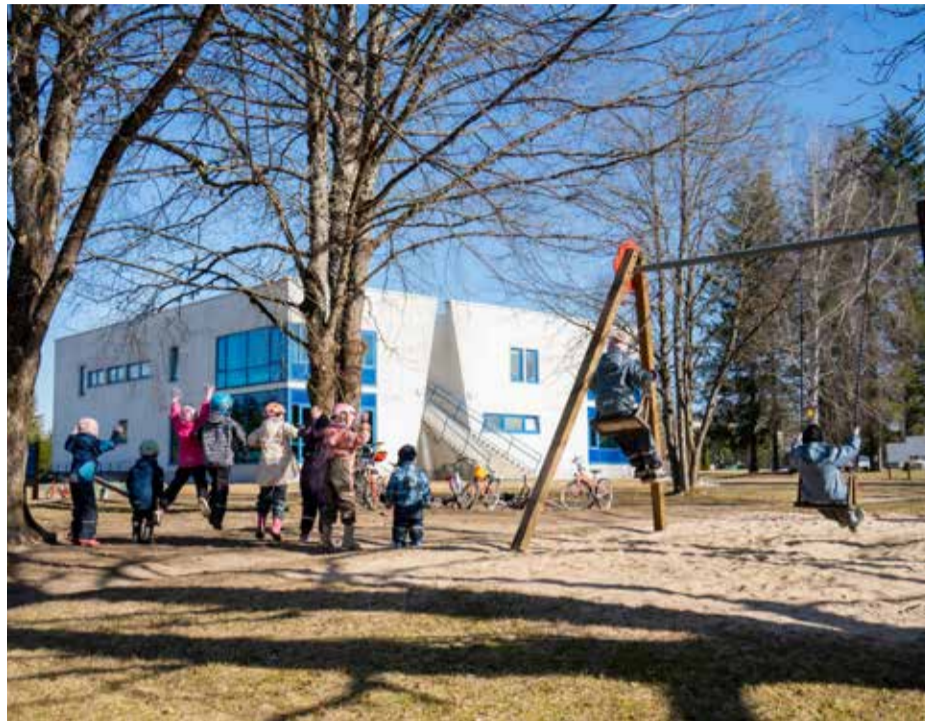
Pillerpuu lasteaia lapsed mänguhoos.

Lasteaia majas on Kose halduse juhitud oma köök, mistõttu on toitlustuse kvaliteet suurepärane. Süüa tehakse värskelt toorainest, lasteaialapsed õpivad ise toitu serveerima, vitamiini-