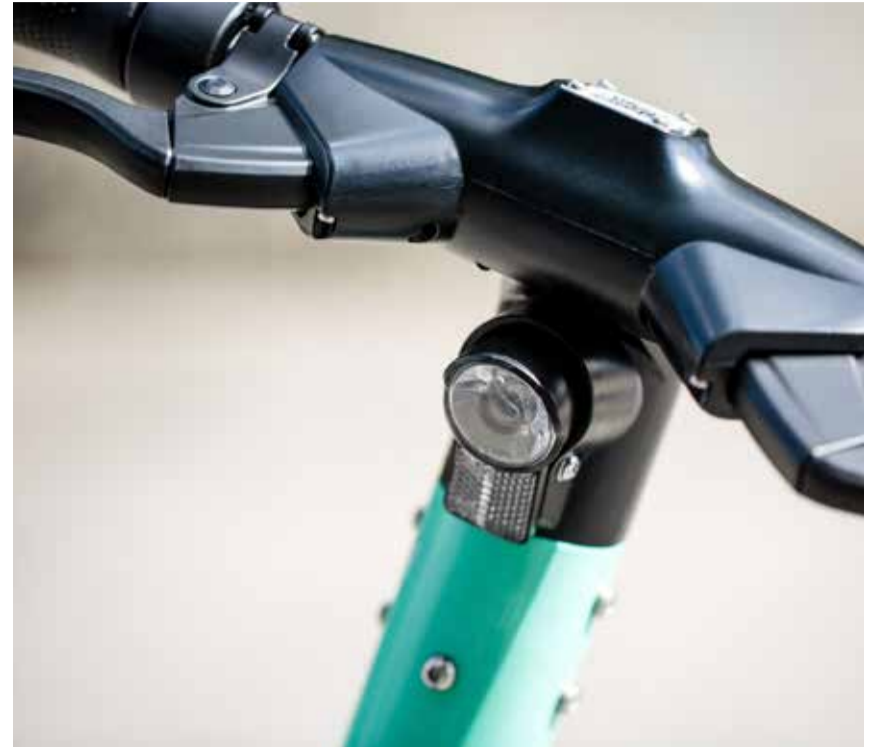
Kas Sinu lapse tõukeratas on tänavalegalne?

Hoiatus lapsevanemale: kui ostad lapsele välismaisest veebipoest „eriti võimsa“ tõukeratta, paned lapse ohtu. Lapse reaktsioonikiirus ei ole mõeldud mootorratta kiirustel liikumiseks ning õnnetuse korral ei