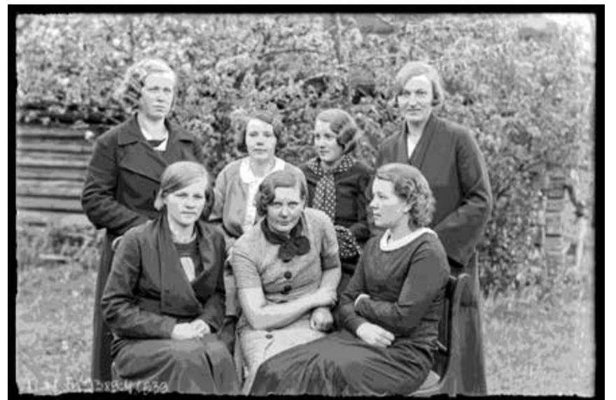
Naiskodukaitse Tuhala jaoskond 1935.

TLM FN 9389:4/639