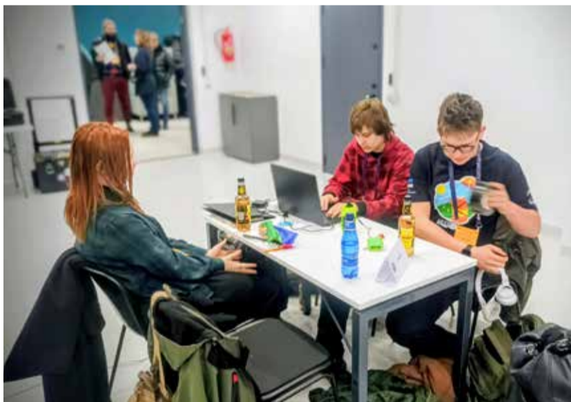
Ardu kooli õpilased CanSatil.

Kuigi andmesides esines esimesel katsel katkestusi, siis teise katse ajaks suudeti tehniline probleem edukalt lahendada ning andmed jõudsid nii maajaama kui salvestusid SD kaardile. Ilmselgelt ei oska ju ette näha, et USB juhtmes võib olla mikrokatkestus ning külma ilmaga