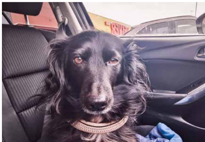
Uuemõisa külakeskuse koer Pille.