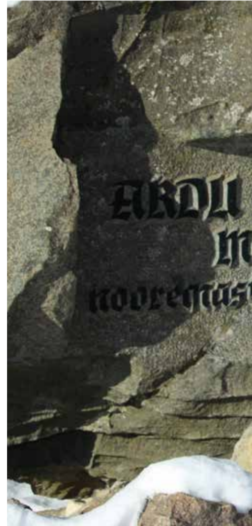
Sirje Saulep ja Ardu mees.

„ Kool asus tänapäeva mõistes väga lähedal, kuid samas ka kaugel – kooliminekuks tuli käia kaks kilomeetrit jala. “