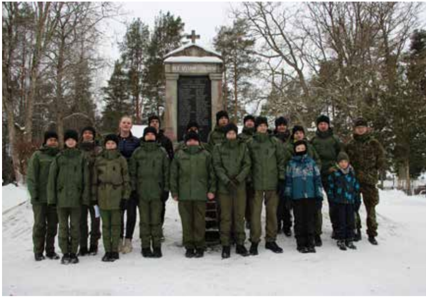
Mälestushetkele kogunenud noored Kose kihelkonna meeste mälestuseks püstitatud mälestussamba juures.