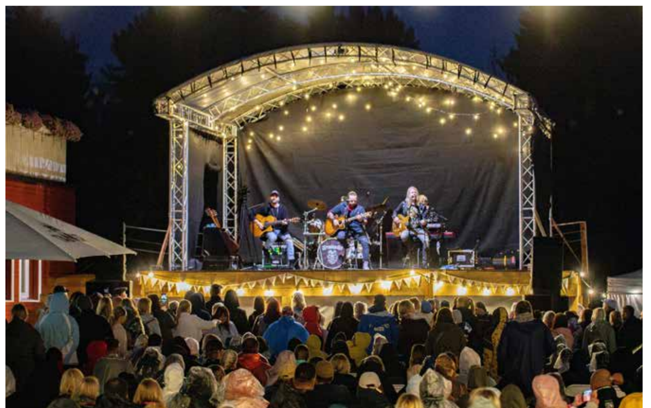
Terminaatori kontsert Tuhala Kultuuritalus.