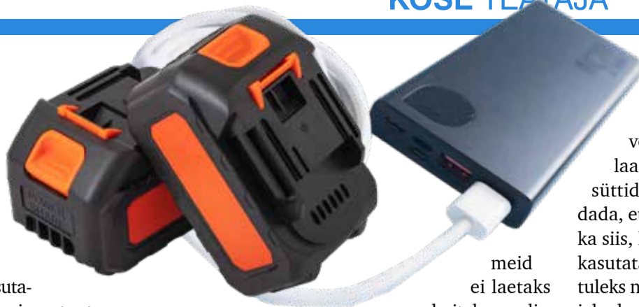
meid ei laetaks

Suurimad ohud akude kasutamisel tulenevad kindlustuse ja päästeameti ekspertide sõnul sageli sellest, et inimesed ostavad tundmatu päritoluga, ilma CE-märgistuseta seadmeid, mille ohutus pole tagatud. Teiseks probleemiks on vigased, niiskust saanud või muul moel kahjustatud akud, mille kasutamine võib viia süttimiseni. „Paraku on ka juhtumeid, kus seadmeid modifitseeritakse iseseisvalt, teadmata, et see suurendab oluliselt tuleohtu. Samuti on riskantne laadida akusid vales keskkonnas – näiteks liialt kuumas, niiskes, halvasti ventileeritud ruumis või päikese käes. Tuleoht suureneb, kui kasutatakse mittesobivaid laadijaid, laetakse seadmeid üle või jäetakse need järelevalveta tööle,“ ütleb BTA Kindlustuse