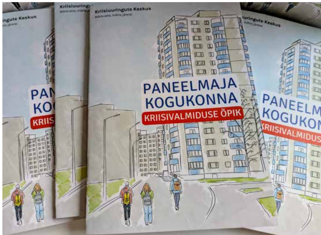
Paneelmaja kogukonna kriisivalmiduse õpik.

Ei tohi unustada, et ka igal koos elaval leibkonnal peaks olema läbi räägitud pere kriisiplaan. Igal perel peaks olema vähemalt seitsme päeva varu, mis võimaldab toime tulle kesksete teenuste katkemisel ehk olukorras, kus poest ajutiselt süüa ega vett osta ei saa. Kriisiuuringute keskuse soovitus: ostke varud ära esimesel võimalusel ning vastavalt enda ja kogukonna võimalustele püüelge vähe-