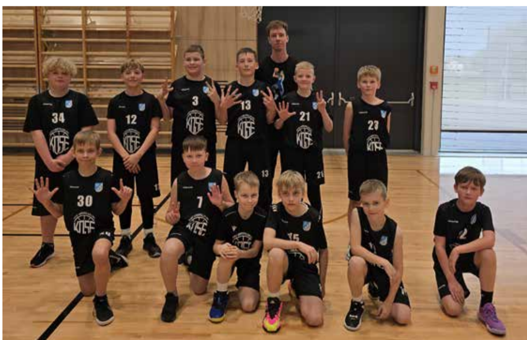
Pildil U12 vanuseklassi Kose korvpallurid pärast võitu Paide meeskonna üle.

U12 vanuseklassis osaleti esimest korda Eesti meistrivõistluste II divisjonis. Seitsme etapi jooksul peeti 15 mängu, millest võideti seitse. Kokkuvõttes saavutati 9. koht 16 võistkonna seas. Tähelepanuväärne saavutus tuli ka Harjumaa „Osavaima korvpalluri“ võistlusel, kus