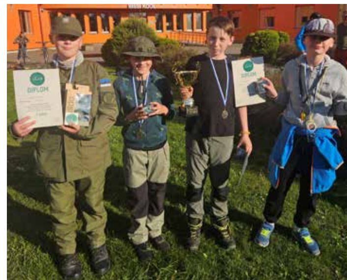
Võidukas Kose noorkotkaste meeskond.

Kuivajõe külas asuva Kõrtsi katastriüksuse detailplaneeringu avalikul väljapanekul laekus planeeringu kohta üks vastuväide, mis pidas sobimatuks ladude kompleksi kavanda- mist Krei küla miljöösse, väärtuslikule põllumajandusmaale ja põhjavee nõrgalt kaitsitud alale. Vastavalt planeerimiseaduse §-ile 136 korraldab Kose vallavalitsus detailplaneeringu avaliku arutelu Kose valla (Hariduse tn 1, Kose alevik) saalis 01.07.2025 algusega kell 17.00. Küsimused ja täiendav info: Kose vallavalitsuse majandusosakond, Siiri Hunt, arhitekt ( siiri.hunt@kosevald.ee , telefon 5470 0707).