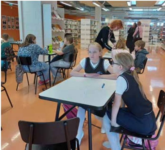
Kose valla tüdrukud mälumängu mängimas.