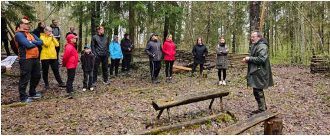
Matkalised matkajuhti kuulamas.

Paljudele kohalikele juba tuttav Kiruvere rada avas end seekord uue nurga alt. Paunküla veehoidla rajati 1960. aastal Pirta jõe paisutamise teel ning selle pindala on ligikaudu 450 hektarit. Veehoidla alla jäid kolm järve: Väike- ja Suur-Seapilli ning Tudre järv. Tegemist on Eesti kõige saarterikkama siseveekoguga – seal leidub üle 20 saare ja saarekese, millel on vahvad nimed, nagu näiteks Seapilli, Tudre, Mustakannu, Mesipuu, Püksiireesaared ja Kellakoti saar. Veehoidla rannajoone pikkus on 13