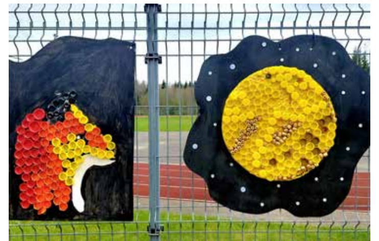
Näitusel saab näha kuud uudistavat rebast.