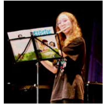
Sipsik on üks Eesti laste armastatumaid raamatutegelasi.

3. aprillil tähistati Kose kultuurikeskuses 500 aasta möödumist esimese eestikeelse raamatu ilmumisest Kose huvikooli õpilaste-õpetajate, Kose gümnaasiumi ja raamatukogu koostöös valminud kontserdiga „Eesti raamat 500 muusikas“.