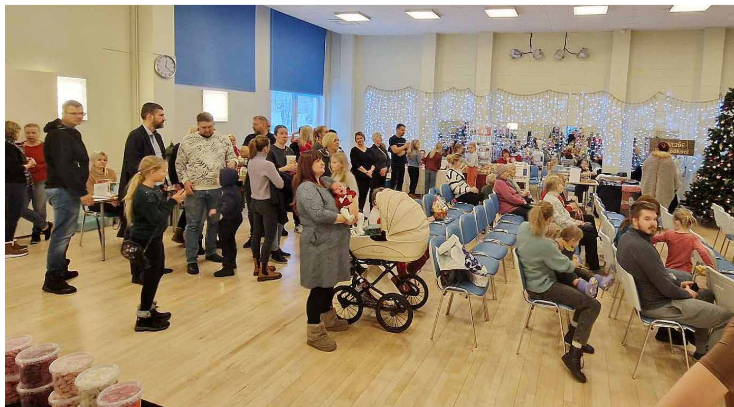
Huvi jõululaadal pakutu vastu oli suur.

Isetehtud jõulupuude konkursi korraldamise traditsioon sai alguse viis aastat tagasi Kolu külast. ↓