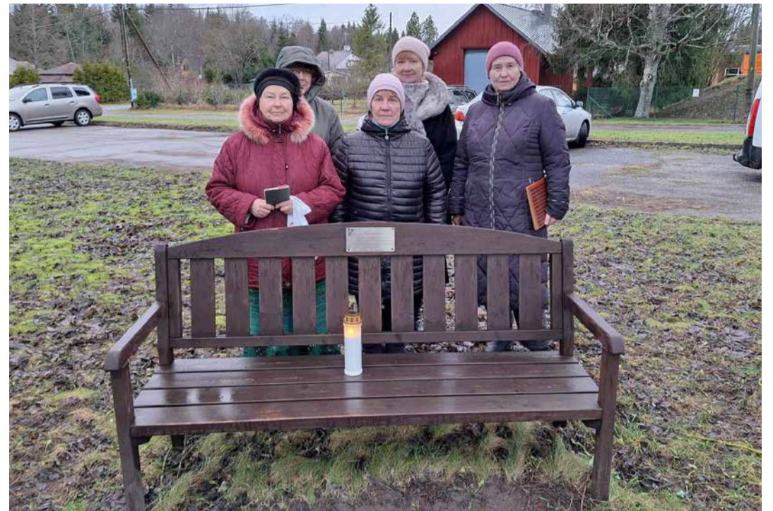
Ardu raamatukogu lugemisringi liikmed.