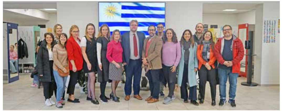
Kauged külalised said kokku nii kooli töötajatega kui ka vaatasid ringi koolimajas.

Tutvuti algklasside majas digipädevuste arendamise-