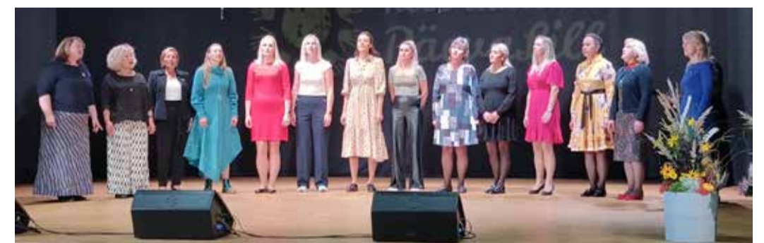
Sünnipäeval esines õpetajate ansambel.

Pidulik aktus külalistega toimus 26. septembril Kose