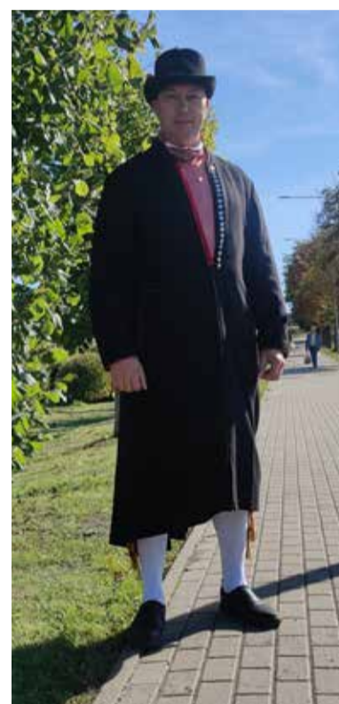
Rahvatantsu pisik on olnud nakkav, sest peaaegu terve pere tantsib.