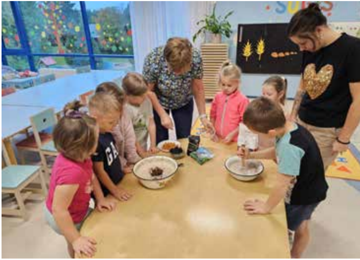
Leivategu lasteaia täitis ruumid leivalõhnaga ja õpetas ka traditsioone hindama.