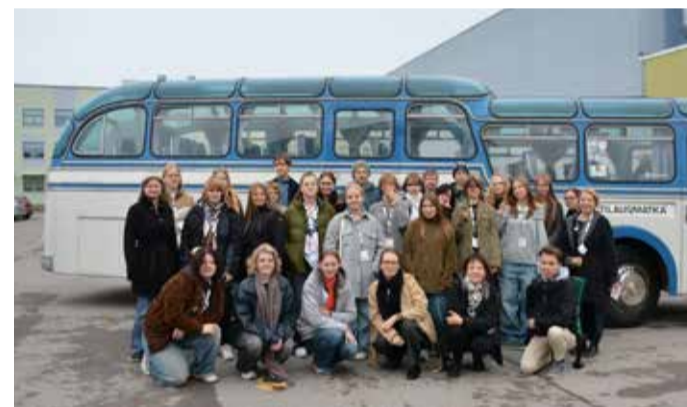
Disainilaagrit võõrustab igal aastal erinev koht, seekord oldi kogunenud Kosel.

NoDi viiakse läbi erinevatel aastatel erinevates Eestimaa paikades, seekord toimus see Kosel. Laager leidis aset viiendat korda ja sellest võtsid osa 13–17-aastased noored, keda juhendasid professionaalsed disainerid/mentorid. Kokku osales 26 noort Tallinnast, Koselt, Tartust ja Viljandist ning teemaks oli seekord tootmisjärgid tööstuses. Kolme päeva jooksul uuriti Kose vallas tegutsevate firmade