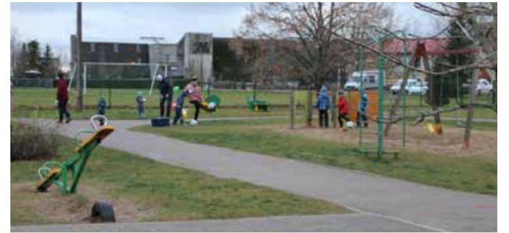
Lapsed isadepäeval Oru lasteaia mänguväljakul