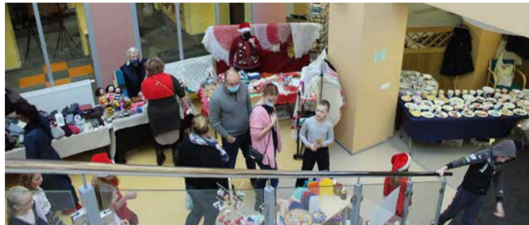
Jõuluturg on täies hoos.