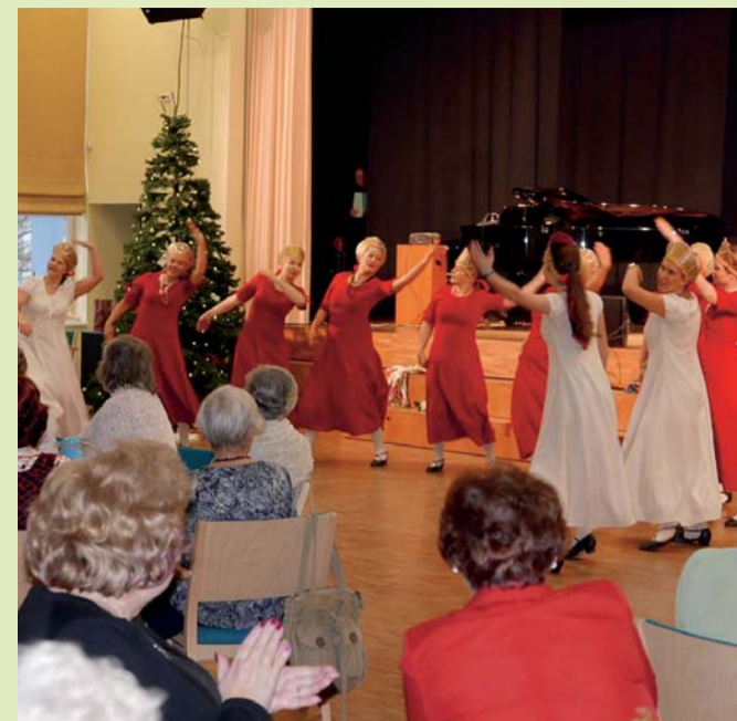
Tantsurõõmu Oru tantsijatelt.