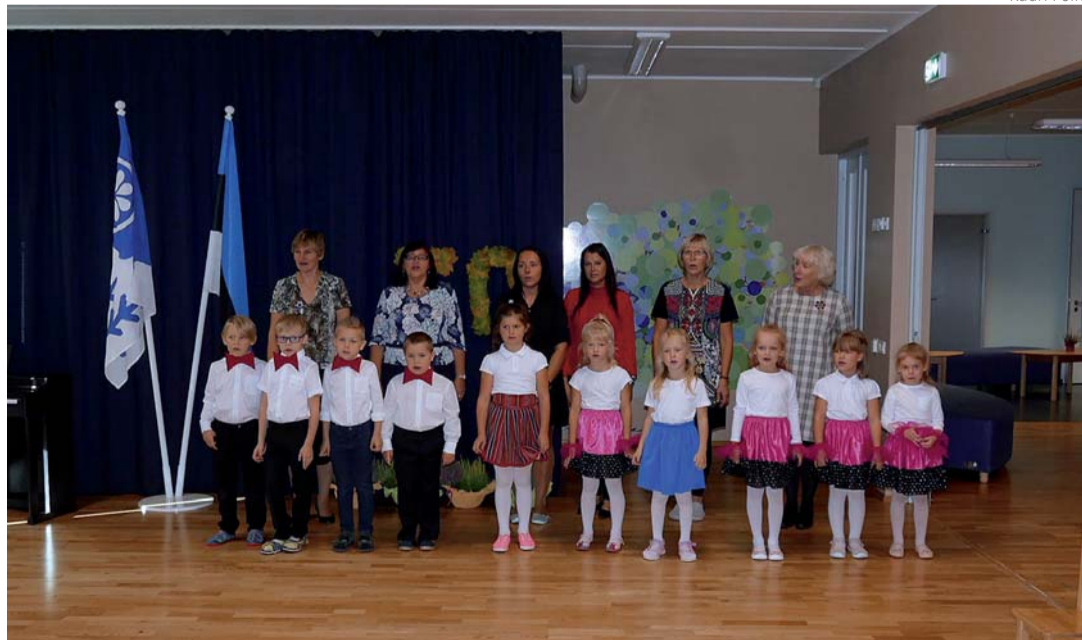
Lapsed ja õpetajad saavad hästi hakkama ka ühise esinemisega.

Õnne olid soovima tulnud "külalised minevikust" - nagu nad ise