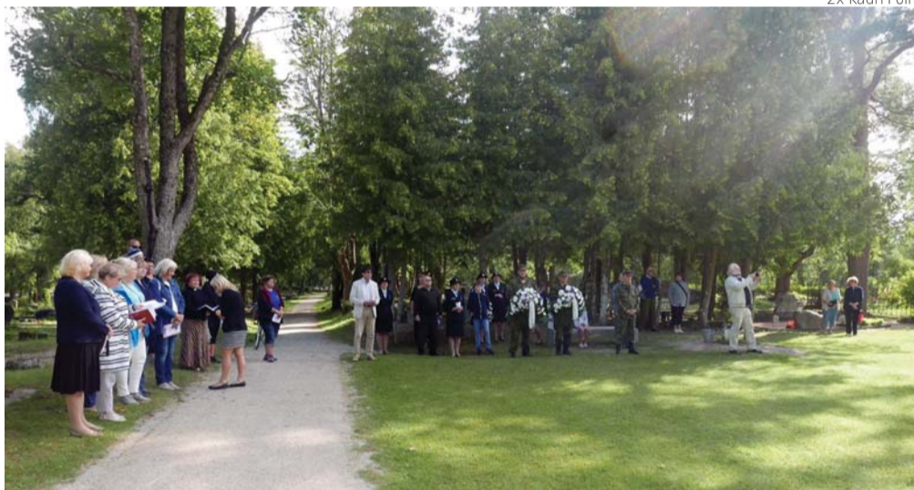
2x Kadri Põlm