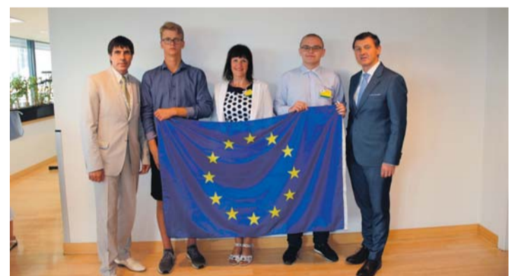
Kose Gümnaasiumi delegatsioon Euroopa Regionide Komitee vastuvõtul