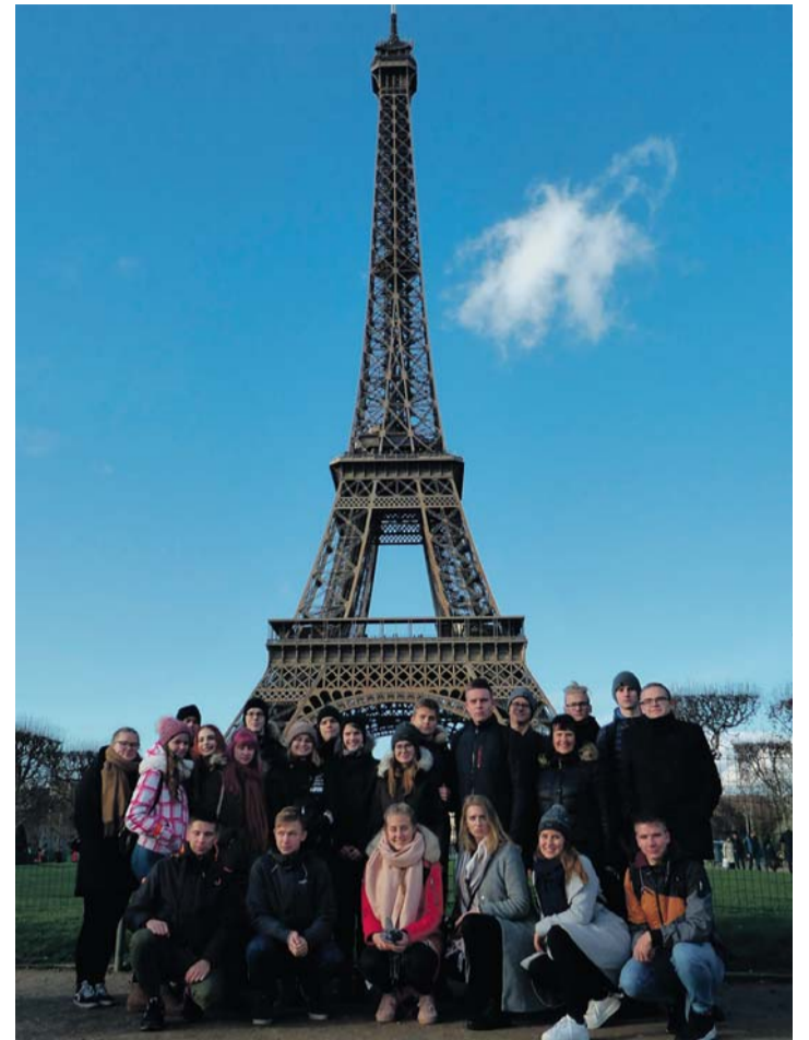
Kose Gümnaasiumi delegatsioon Eiffeli torni juures