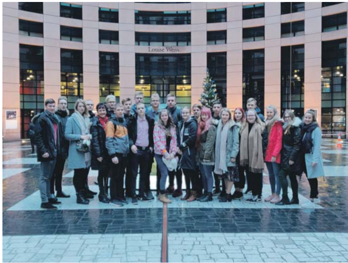
Kose Gümnaasiumi delegatsioon Strasbourgis