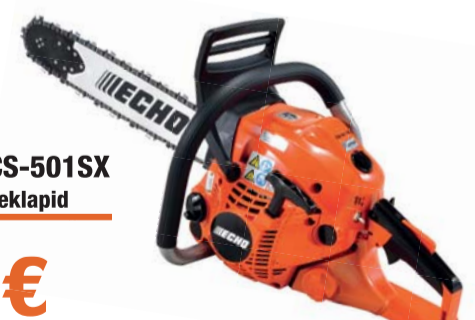
MOOTORSAAG CS-501SX + kanister + kiirtäitekapid