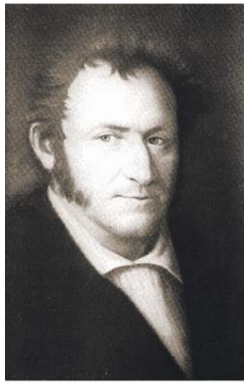
Peter August Friedrich von Manteuffel

2018. aastal pühendatakse kogu krahv Manteuffeli kultuuripärandile, 2018. aasta on Euroopa kultuuripärandiaasta ja krahvi panus Eesti kultuurilukku on märki-