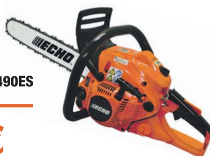
MOOTORSAAG CS-490ES + lisakett