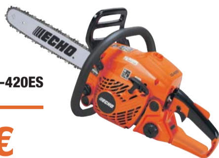
MOOTORSAAG CS-420ES + lisakett