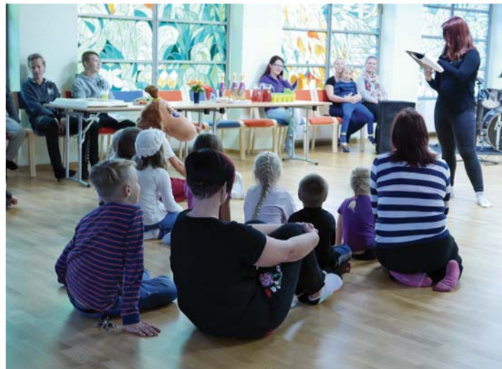
Noorsootöö on oluline igas valla osas. 2. septembril avati pidulikult ja rokirütmis Habaja Noortekeskus.

Samuti pidasime oluliseks tagada kõik olulisemad teenused ja konkurentsivõimeline haridus lasteaiast kuni gümnaasiumi lõpuni vallas koha peal. Oleme seisnud kõik need neli aastat selle eest, et meie vallas jääks alles võimalus saada gümnaasiumiharidust. Seisime selle eest, et kõik lapsed saaksid oma kooliteed alustada kodulähedastest koolist. Kose-Uuemõisa ja Harmi kool kestavad, kuna mõlema piirkonna elanikele on see oluline vajadus. Hariduse and-