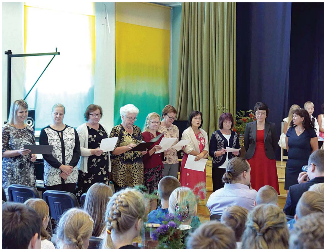
Ardu õpetajad üllatasid 1. septembri aktusel ilusa luulepõimikuga.

Oluline osa selles on lisaks kooli eelarve võimalustele ka KIK-i projekti abil saadud lisarahastus loodusteadlikeks õppeprogrammideks ja õppekäikudes, samuti Digi-pegel abil saadud tahvelarvutitest