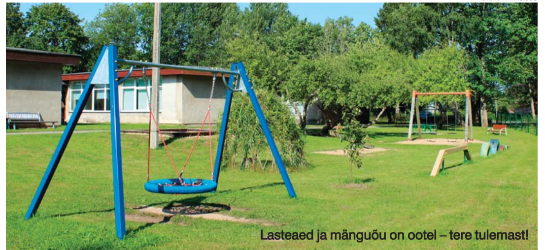
Lasteaed ja mänguõu on ootel – tere tulemast!

mesi enda ümber – tänu Ravila lasteaia laste kunstitöödele said hubasema ilme Hooldekeskus Kose Kodu toad ja koridorid.