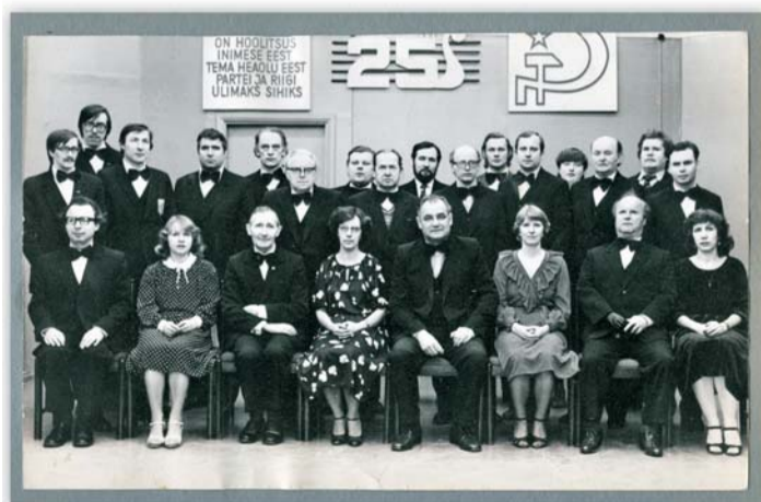
Fotomeenus 1992. a. Eki (esirase vasakult kolmas) Pimedate puhkpilliorkestri 25. juubelil