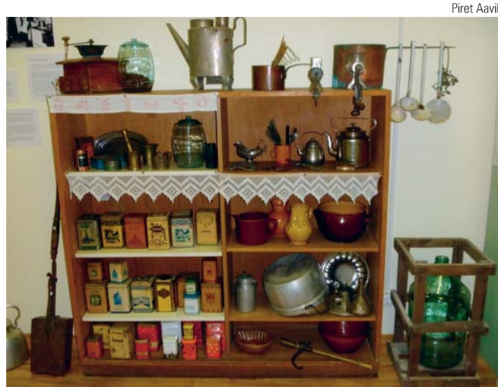
Saja aasta vanune köögivaade äratub mälestusi.

Tore on jõuda näitust vaadates tödemuseni, et tegelikult pole midagi uut siin päikese all, nii on ka köögitarvetega – pea saja aasta jooksul on peamiselt muutunud esemete materjal ja kuju. Siiski on näituse olulisem emotsioon „äratundmisrõõm“ – jah, tõepoolest,