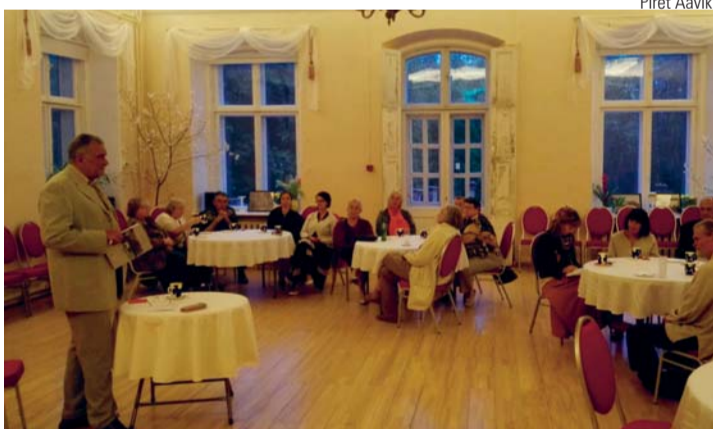
Raamatu esitus tõi kokku palju kohalikke kultuurihuvilisi.