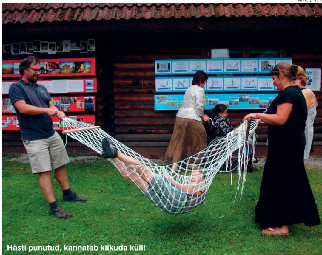
Hästi pununud, kannatab kiikuda küll!

Käsitööpäeva projekti rahastas rahandusministeerium Kohaliku Omaalgatuse Programmist. Kuna