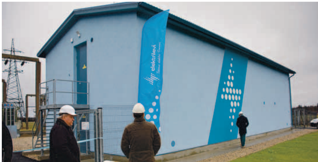
Uus piirkonnaalajaam toob Kose alevikku lisaks elektrikindlusele ka arhitektuurilist värskest.

Kose alajaama uuendamiseks valmis esimene etapp suuremast projektist, mille raames uuendatakse kahele järgneval aastal ka alajaama kõrgepinge osa ning rekonstrueeritakse Kehra ja Kose vaheline elektriliin. | Marvel Riik