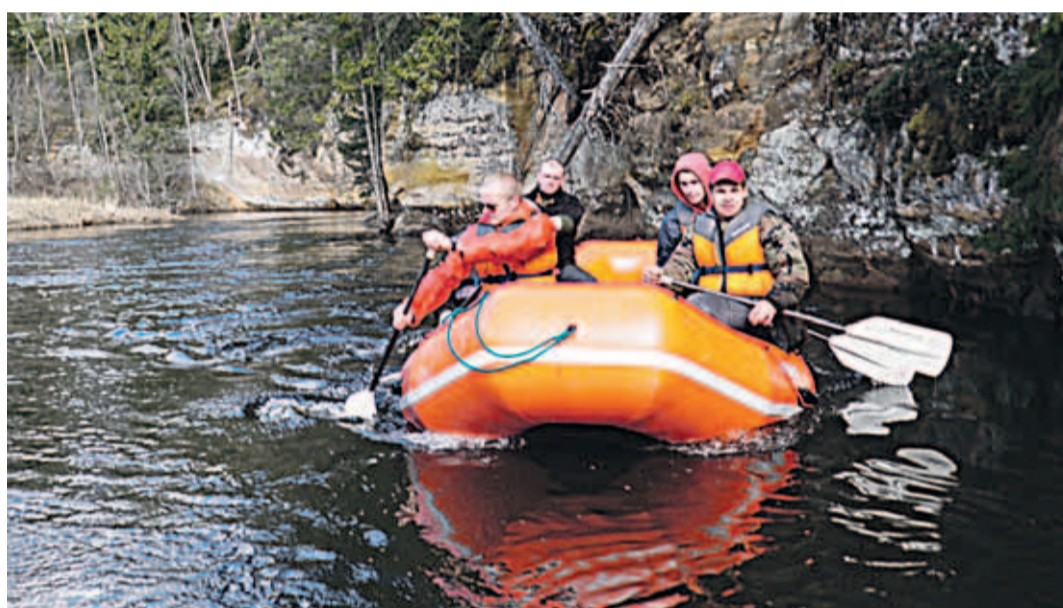
Esimesed raftingud Slovakkias viisid mõttele soetada üks parv ja alustada esimesena Eestis raftingu pakkumist ka teistele huvilistele.

Meie meeskond veedab ise aega kõige meelsamini looduses, iga ilmaga. Just huvi Eesti vastu aitab meil välja mõelda iga aasta uusi matkamarsruute ja tegevusi. Ettevõtte, kellele oleme korraldanud suvapäevi mitu aastat, soovivad igal aastal huvitavaid erilahendusi. Meie jaoks on alati meeldiv väljakutse, kui saame ka enda jaoks midagi uut välja mõelda. Avastame Eestimaad igapäevaselt ja meil on varuks palju sihtkohti, kus loodus on veel puutumata, kohti, kus muinaskülal sammaldunud varemetega on peitunud sügavale metsa. Rahulikule loodusele vastukaaluks teame ka marsruute, mis hoiavad adrenaliini kõrgel – safariautod ja kevadine rafting – need on tegevused, mis toovad ka kõige rahulikumas inimeses tugevad