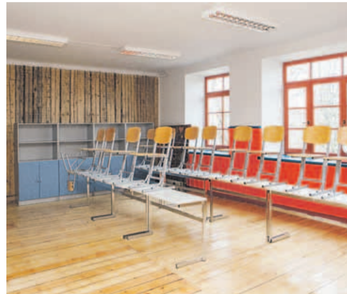
Värsked kuue saanud kunstiklass, kogukonna ühine loomine ja kätetöö.