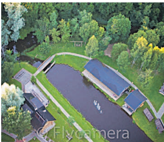
Oxforelli Puhkekeskuses pakub erinevaid ajaveetmise võimalusi.