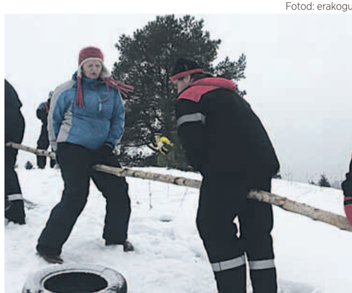
Viskla külakogukond lõbusaid võistlusi pidamas.

Ega's midagi! Ühelt sõbralt püksid, teiselt saapad ja nii oligi talispordiriuetus koos. 14.