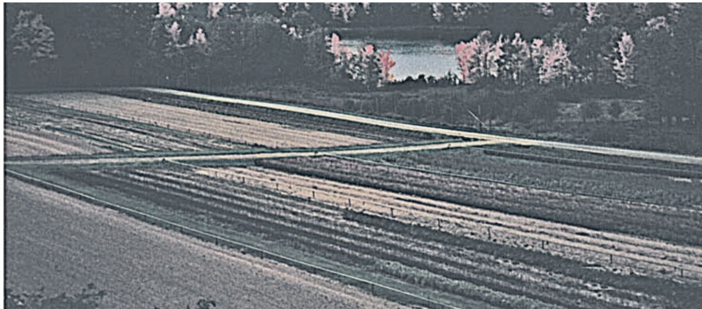
Väikefarmi põld Pennsylvanias.