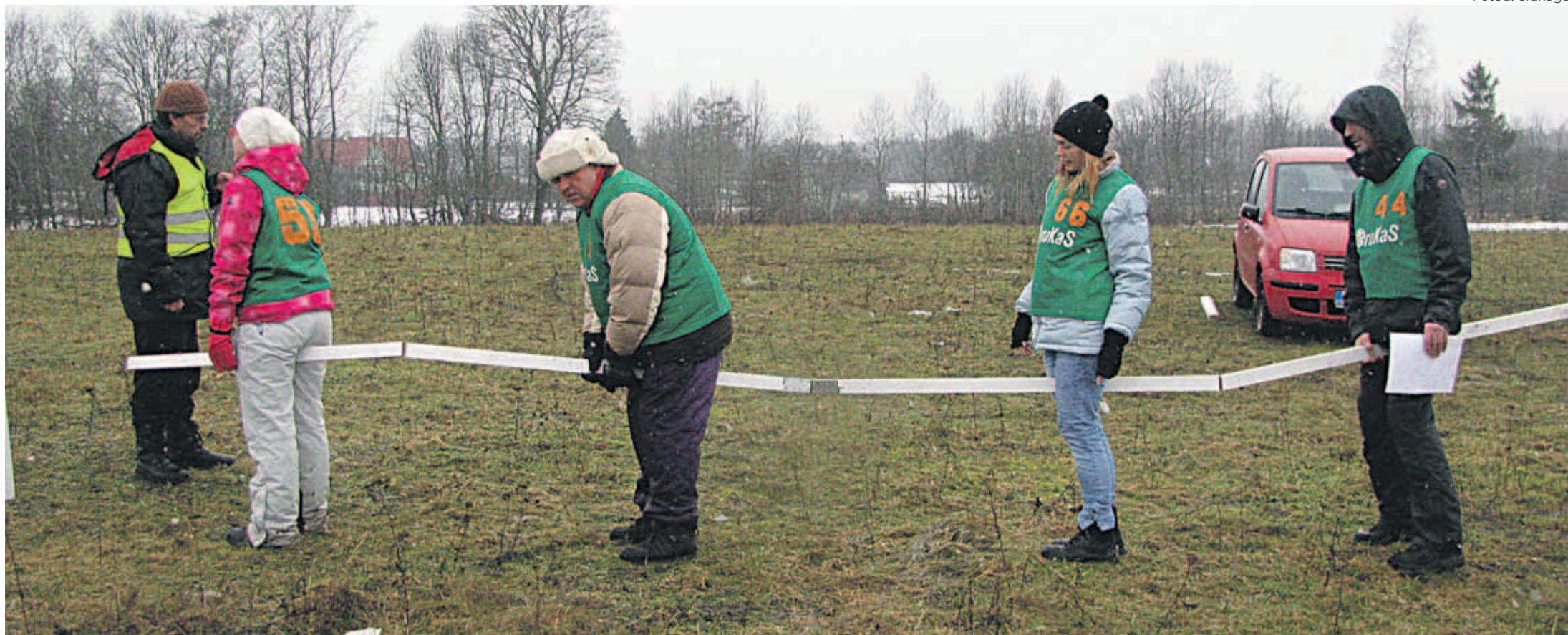
Spordivõistlusi jagus terveks päevaks.