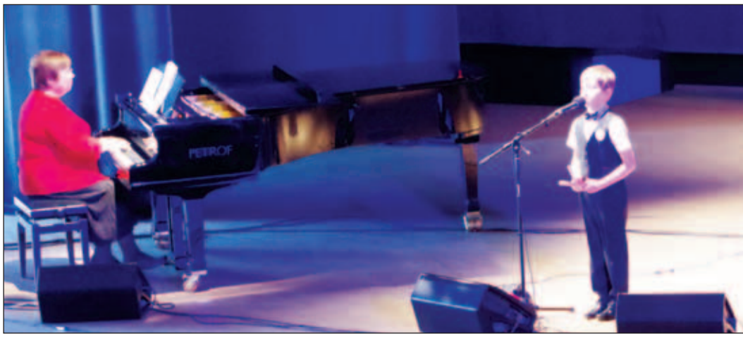
Südikalt esinesid ka nooremate vanuseklasside lapsed.

Tahaks loota et kaasava eelarve protsess muutub Kose vallas tavaks, mis areneb ning tugevdab arusaama, et valla elanikud ja kogukond moodustavadki Kose valla.