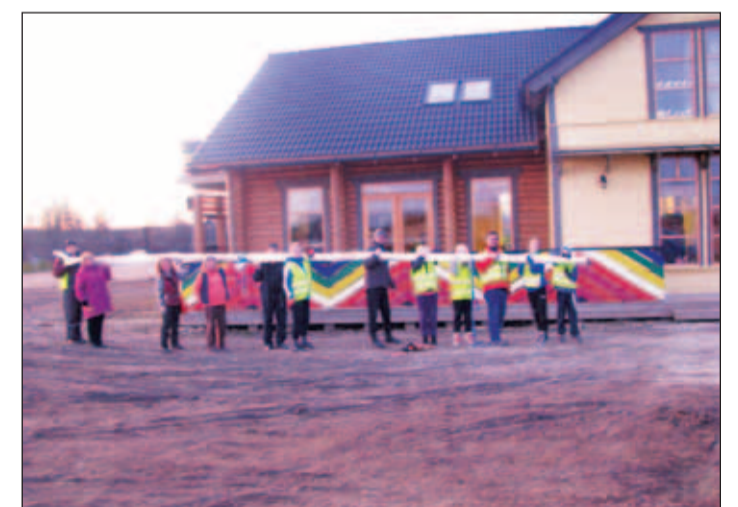
Ja jõudsidki kohale...

Pärast sellist ponnistust oli loomulikult paus. Tehti inventuur külavanema auto pagasi-ruumis (muljetavaldav), ko-sutati veidi kärbuma hakanud