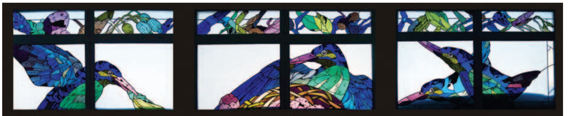
Taastatav vitraažpannoo täies hiilguses.