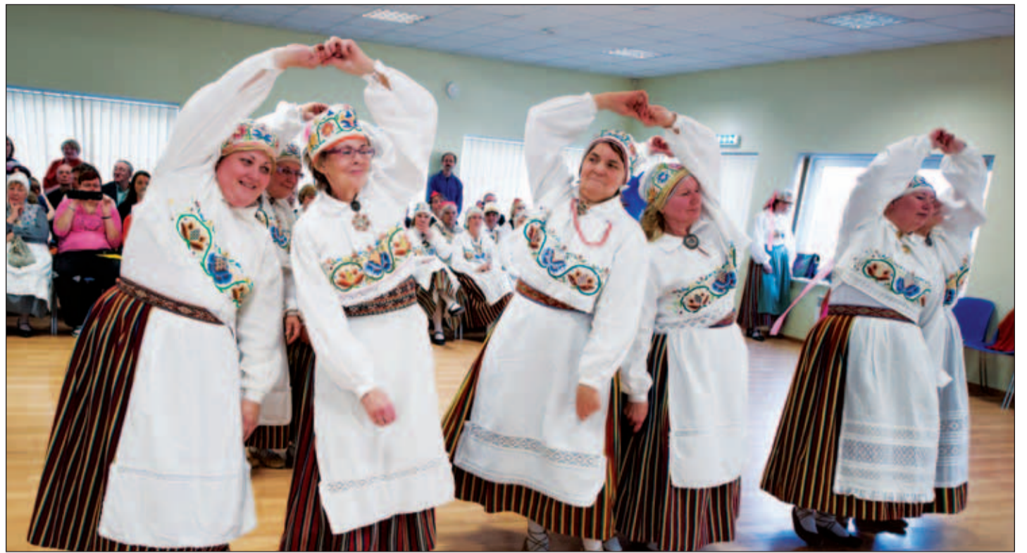
Oli igati vahva päev, päev täis liikumist ja naeru.

Loodame, et oleme aluse pannud ilusale ja vajalikule traditsioonile.