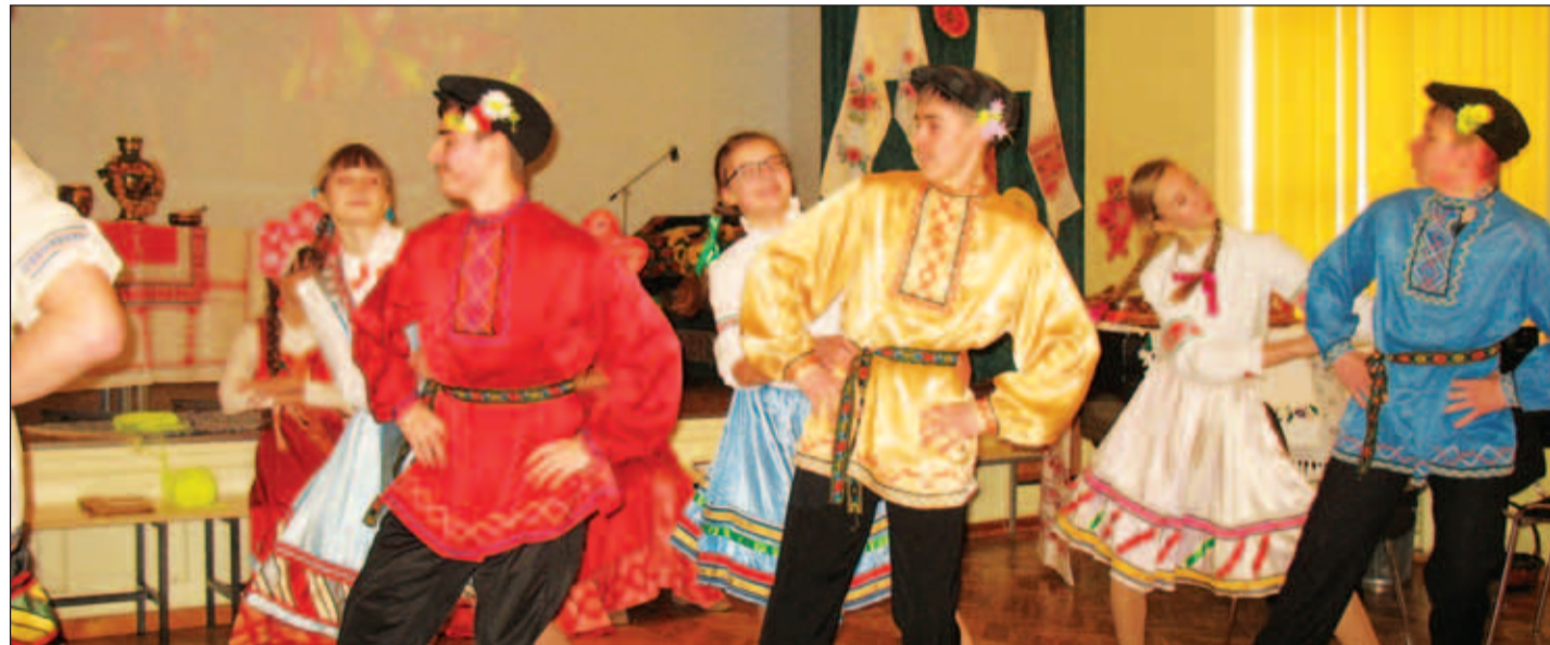
Paldiski Vene Gümnaasiumi noored Kose Gümnaasiumis.