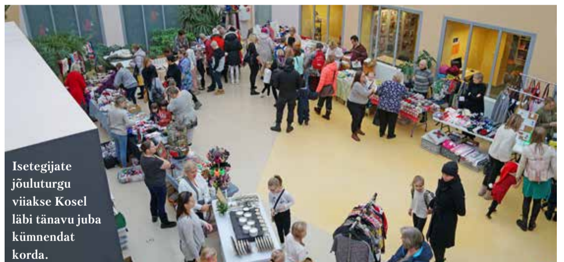
Isetegijate jõuluturg viiakse Kosel läbi tänava juba kümnendat korda.

Kose Valla Isetegijate jõuluturg on avatud esimesel korrusel. Osta saab toitu, küpsetisi, kingitusi, puidust käsitööd ja palju muud.