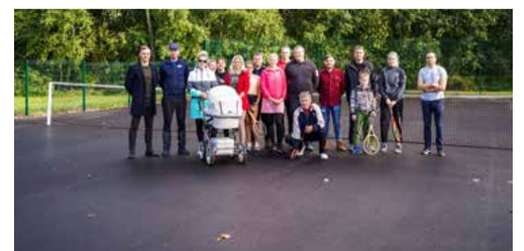
Ardu alevikuseltsi liikmed ja tennisesõbrad uuel väljakul.

Septembri alguses paigaldati uus väljaku kate ning kuu keskel uus piirdeaed. Septembri lõpus paigaldasid alevikuseltsi