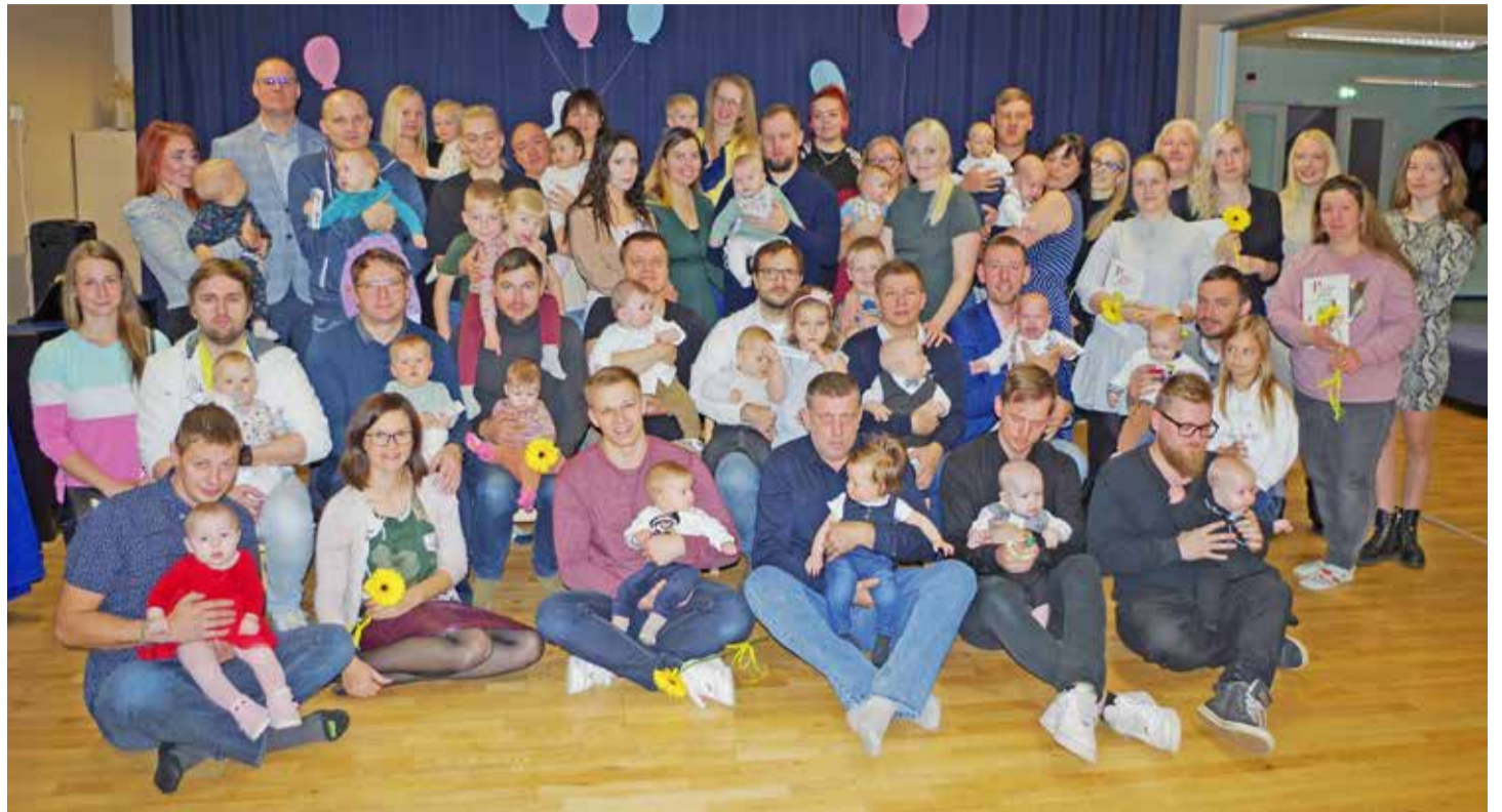
Seekordse lusikapeo päevakangelased ühispildil.