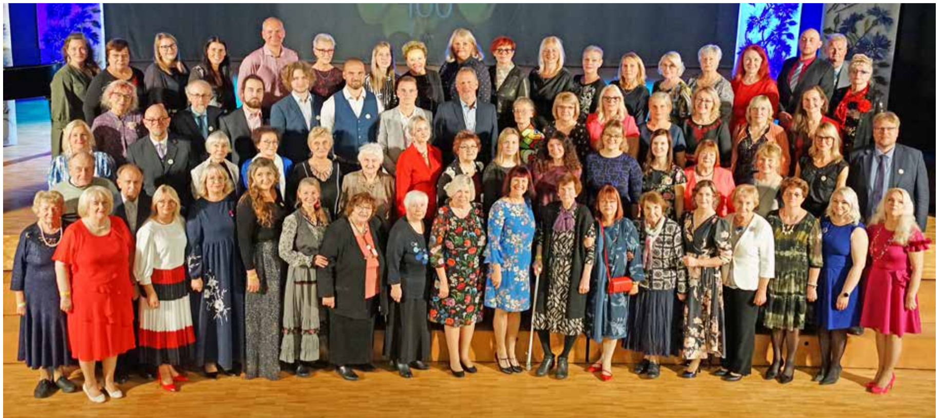
Kose gümnaasiumi õpetajad.

Järgnes pingeliste läbirääkimiste ja kokkulepete tegemise aeg – kellel tuli järel käia,