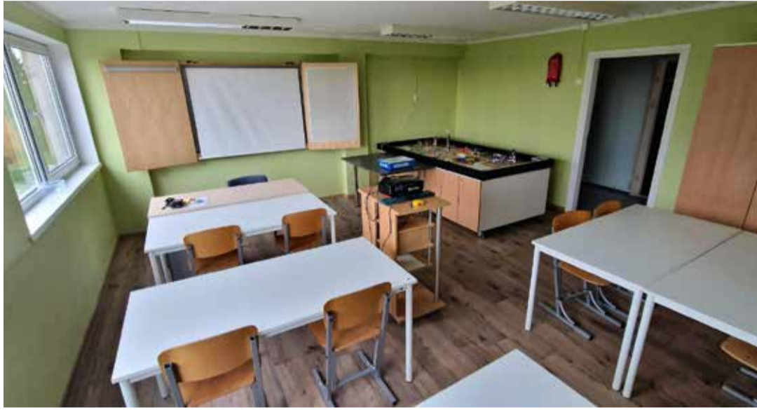
Remondijärgselt sai Kose huvikool kaunitult viimistletud siseruumid, lisandusid uus mööbel ja uued õppevahendid, mis kõik kokkuvõttes parandab huvikoolis õppimise tingimusi.

Kolm aastat tagasi, 1. septembril 2020 alustas Kose huvikool õppetööd nelja osakonnaga: kunst, muusika, sport ja robotika. Kui muusika- ja spordiosakonnas algas õppeaasta tavapärasel moel, siis kunsti- ja tehnikaosakond avasid 2023/2024. õppeaastal ukсед uutes ruumides Kosel, Hariduse 2a majas.