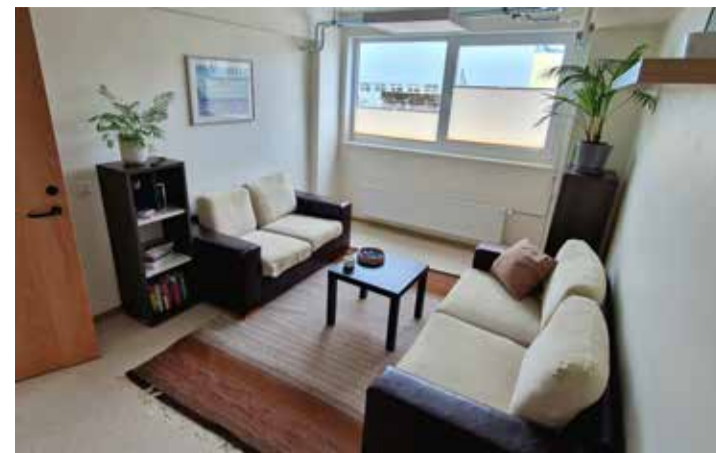
Kose päevakeskuse põhjalikult renoveeritud ruumid.