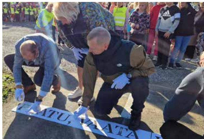
Vallavalitsuse ja ehitusfirmade esindajad värvivad teele hoitava lause.

Septembrikuus koguti kampaania korras toetust Rohelisele lipule oma lipuvõtmiste juurutab õpilastes igapäevast keskkonnasäästlikku mõtteviisi. Oru kool on olnud nende põhimõtete järgimisel