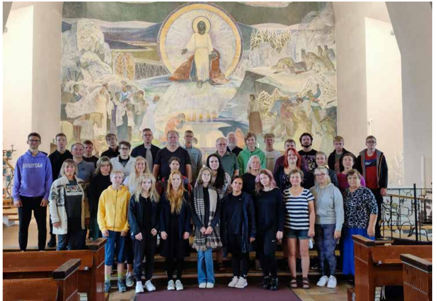
Kose lauljad Lapi- ja Saamimaa reisirühma esinemas Rovaniemi kirikus.