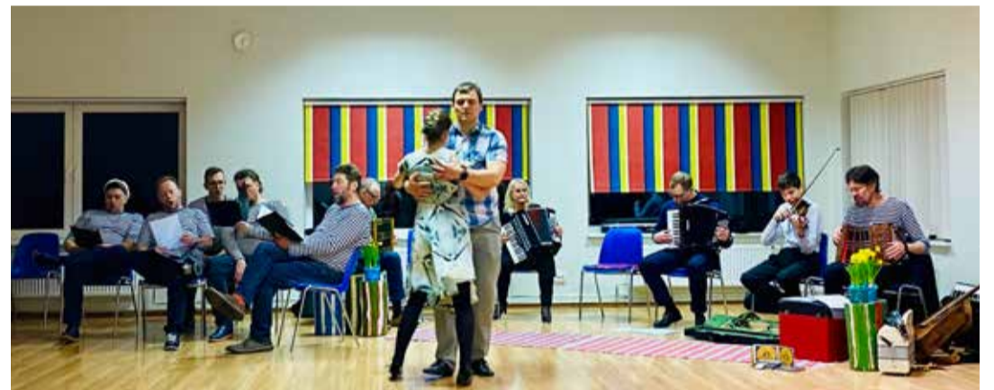
Hetki tantsu- ja muusikasõprade üritusest Kose-Uuemõisa külakeskuses.

Paastumaarja(naiste)päeva tantsuklubi ürituse eripära seisnes eelkõige selles, et erinevalt tavapärasest tantsuklubist oli ürituse rikastamiseks kaasatud ka Kuivajõe meeskoori mehed, kes lahkelt kostitasid kõrtsitoas külalisi, eelkõige just naisterahvaid,