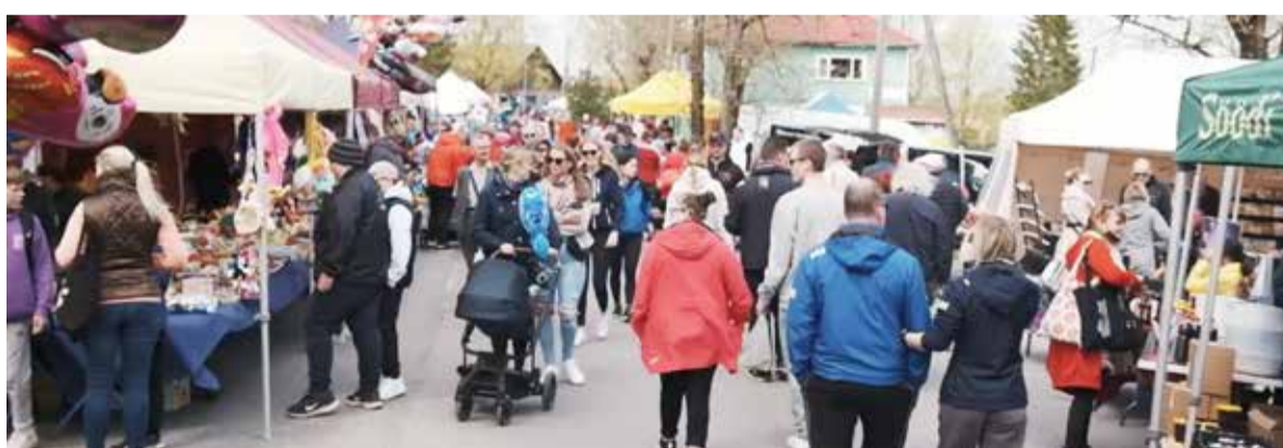
Elmisel aastal toimus kevadlaad „Kose kutsub külla!“ pärast kaks aastat väldanud koroonapausi ning kujunes eriti rahvarohkeks.

Traditsiooniliselt sisustavad päeva meie enda valla esinejad, muusikat nii tant-