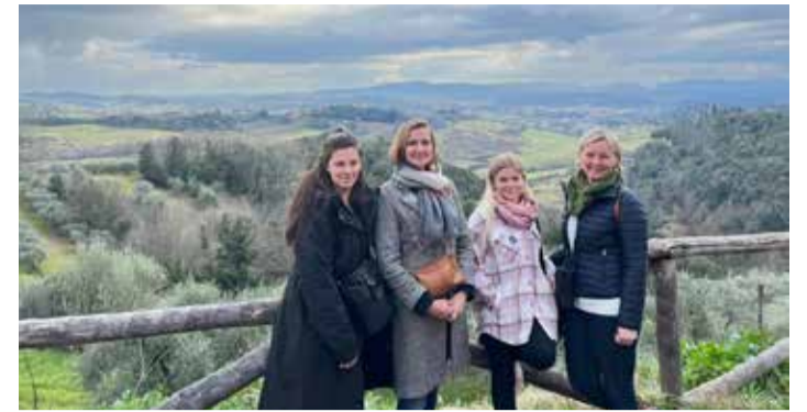
Reisiseltskond Itaalias. FOTO: ERAKOGU Erasmus+