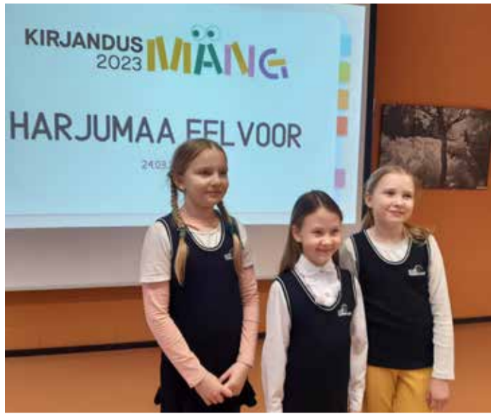
Tänavuse kirjandusmängu võitjad.