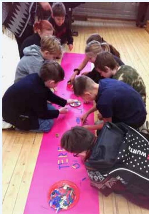
Emakelepäeva tegemisi Ardu koolis.