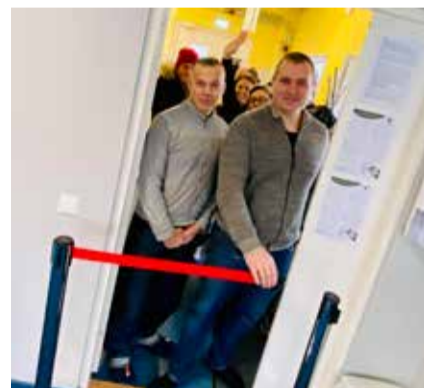
Fotomeenutused heaolu- ja ilupäevast Kose-Uuemõisas.