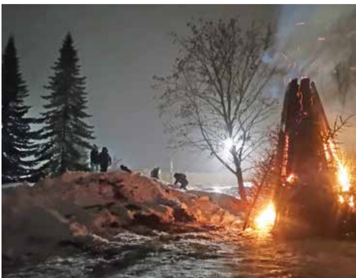
Mesimummu lasteaia uhke lõke.