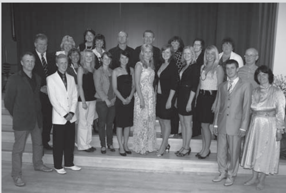
Vallavanema vastuvõtt edukamatele koolilõpetajatele ja nende vanematele