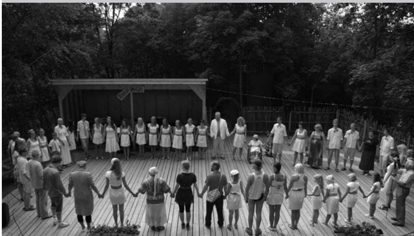
Muusikaliprojekti „Suvevärvid“ viimane etendus 18.juulil.